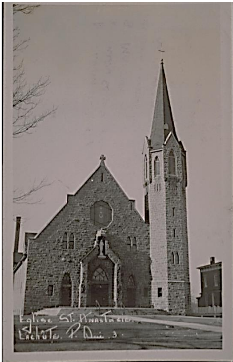
Église St. Anastasia. Lachute, P. Qué.

Dans les archives consultées 1 par GDA, on relève que la construction de l'église actuelle, qui date de 1936-1937 serait d'inspiration Dom-Bellotiste . Dom Bellot était un religieux, architecte français né à Paris le 7 juin 1876 et mort à Québec le 5 juillet 1944; il était spécialisé en architecture religieuse. Bellot finira sa vie au Canada. Il a participé à la construction de l'Abbaye Saint-Benoît-du-Lac en Estrie et à la conception du dôme de la basilique de l'Oratoire Saint-Joseph du Mont-Royal. Dom Bellot, en Europe, aurait également orné des couvertures de ses constructions de différents motifs.